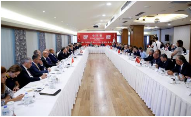
KKTC III. Yatırım Danışma Konseyi Toplantısı

Cumhurbaşkanı Yardımcısı Fuat Oktay konuşmasının sonunda, KKTC'nin kendi ayakları üzerinde durmasına, kalkınmasına, ekonomisinin güçlenmesine katkı koymaya devam edeceklerini, Forumun da buna vesile olmasını temenni etti.