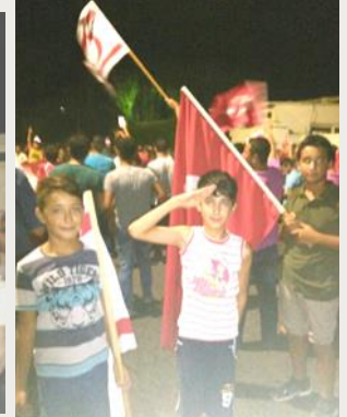
Büyükelçiliğimiz önünde 20 Temmuz'da vatandaşlarımızın "Milli İradeye Sahip Çık" ve 15 -16 Temmuz gecesi yaptıkları destek eylemleri