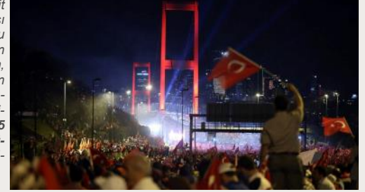
15 Temmuz Şehitler Köprüsü

246 vatandaşımızın şehit olduğu kalkışma sonrası yapılan Bakanlar Kurulu toplantısının ardından Başbakan Binali Yıldırım, darbelerin ilk hedefi olan ve çok sayıda vatandaşımızın şehit edildiği Boğaziçi Köprüsü'nün adının " 15 Temmuz Şehitler Köprüsü " olarak değiştirildiğini açıkladı.