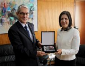
KKTC MECLİS BAŞKANI