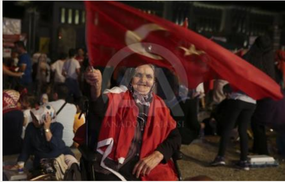
Cumhurbaşkanlığı Külliyesi önünde "Demokrasi Nöbeti"

FETÖ/PDY mensubu askerlerin darbe girişiminin hemen ardından Cumhurbaşkanı Recep Tayyip Erdoğan'ın, "Milletime çağrı yapıyorum, meydanlara gelin, meydanlarda bunlara en güzel cevabı verelim. Bu darbe girişiminin başarılı olacağına inanmıyorum. Tarih boyunca darbelerin hiçbiri başarılı olamamıştır." çağrısı üzerine darbe girişimine karşı gelen milyonlarca vatandaşımız Demokrasi Nöbeti için meydanlara akın etti.