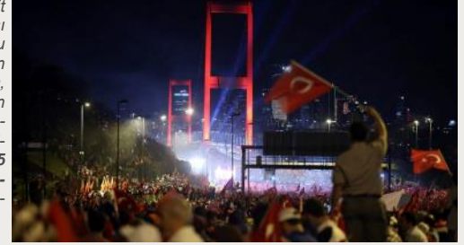
15 Temmuz Şehitler Köprüsü

246 vatandaşımızın şehit olduğu kalkışma sonrası yapılan Bakanlar Kurulu toplantısının ardından Başbakan Binali Yıldırım, darbelerin ilk hedefi olan ve çok sayıda vatandaşımızın şehit edildiği Boğaziçi Köprüsü'nün adının " 15 Temmuz Şehitler Köprüsü " olarak değiştirildiğini açıkladı.