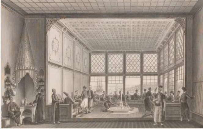
19. yy. başlarında İstanbul'da bir kahvehane, Antoine Ignace Melling

Günümüzde Etiyopya olarak adlandırılan antik Habeşistan toprakları, kahvenin doğduğu yer olarak bilinmektedir. Bunn taneleri (kahve bu şekilde adlandırılmaktaydı) ve yaprakları başlangıçta sadece çiğneniyordu. Muhtemelen 16. yy'da kahve çekirdekleri kavruldu, dövüldü ve kaynatıldı. Etiyopyalıların 6. yüzyılda Yemeni ele geçirip, 50 yıllık yönetimleri sırasında burada kahve çiftlikleri kurdukları düşünülmektedir. Araplar kahve ağaçlarını, kurdukları sulama kanallarıyla birlikte dağların yakınlarında yetiştirmeye başladılar ve ona Arapça'da şarap anlamına gelen kahwa adını verdiler. Coffee (kahve) kelimesi de buradan gelmektedir. Önceleri, Arap Sufi dervişler kahveyi gece namazlarında uyanık kalmalarını kolaylaştırmasını sağlamak amacıyla içiyorlardı. Kahve başlangıçta tıbbi veya dini bir yardım amacıyla değerlendirilse de sonraları günlük kullanıma girdi. Zenginler evlerinde, sadece kahve içme ritüelleri için ayrılan kahve odaları açtılar. Böyle özel bir lükse sahip olmayanlar içinse kahvehane olarak bilinen kahve evleri yaygınlaştı. 15. yüzyılın sonlarında, Müslüman hacılar kahveyi kazançlı bir ticari mala dönüştürerek İslami dünyaya İran, Mısır, Türkiye ve Kuzey Afrika'ya getirdiler. Özenli bir sosyal ritüelde kahve, küçük ibrikte üç kez kaynatılırdı (uzun saplı küçük bakır bir kap). Kahvehaneler insanların birlikte sohbet etmelerini, eğlenmelerini, iş yapmalarını sağlayan mekanlar haline gelmişti.