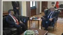
(Lefkoşa, 26 Şubat) Kıbrıs İşlerinden Sorumlu Başbakan Yardımcısı Tuğrul Türkeş, KKTC Millî Eğitim Bakanı Kemal Dürüst ile Çankaya Köşkü'nde bir araya geldi. s.3