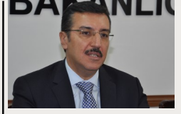
(Lefkoşa, 26-27 Şubat) Gümrük ve Ticaret Bakanı Bülent Tüfenkçi KKTC'yi ziyaret etti. s.2

KKTC Başbakanı Kalyoncu da açıklamasında, Kıbrıs'ta barış ve kalıcı çözüm arayışlarında önemli mesafeler kat edilen bir dönemde bulunulduğunu, müzakerelerin olumlu devam ettiğini, su projesinin kurulacak federal cumhuriyette Kıbrıs Türk tarafı açısından da hayati değer taşıdığını söyledi.