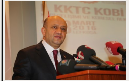
(Lefkoşa, 2 Mart) Bilim, Sanayi ve Teknoloji Bakanı Fikri Işık KKTC'ye ziyaret gerçekleştirdi. s.2