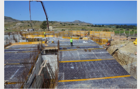
Uluslararası Akreditasyon Çalışmalarına Katkı Projesi: İnşaat Mühendisliği Laboratuvarı

L AÜ Hukuk Fakültesi'ne gösterilen taleple sebebiyle gerekli idari ve akademik mekanların yaratılması için çok amaçlı amfi nitelikli merkezi dersliklere gerek duyulmuştur. Bu amaçla yapımına başlanılan ve toplam 5218 m 2 kapalı alana sahip olan binada; bodrum katta 350 kişilik konferans salonu (570 m 2 ), 3 tane 100'er kişilik derslik (her biri 120m 2 ve bir ofis 27 m 2 ), zemin katta 250 kişilik konferans salonu (295 m 2 ), 2 tane 80'er kişilik derslik (216 m 2 ) ve 5 tane ofis (80 m 2 ), birinci katta 7 tane ofis (140 m 2 ), 1 adet 100 kişilik sanal mahkeme (105 m 2 ), ikinci katta ise 95 m 2 lik 6 tane ofis bulunmaktadır. Proje 24 Kasım 2014 tarihinde ihale edilmiş olup, ihalenin toplam bedeli 8.350.000 TL'dir. Projenin 2016 yılında tamamlanması planlanmaktadır.