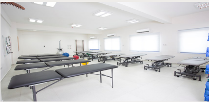
Egzersiz Tedavisi ve Manipulatif Tedavi Salonu

L efke Avrupa Üniversitesi Sağlık Bilimleri Fakültesi Fizik Tedavi ve Rehabilitasyon Bölümü bünyesinde öğrencilerin interaktif eğitimlerine olanak sağlanması amacıyla yeni teknoloji cihaz ve ekipmanları içeren dört uygulama ünitesi kurulmuştur. 2014 yılında 600,000 TL'ye mal olan bu proje sayesinde öğrenciler, çağdaş yöntem ve uygulamaların gereklerine uygun bir şekilde derslerini yapma olanağına kavuşmuşlardır.