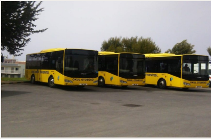
Sağlık Bilimleri Fakültesi Laboratuvarları Teçhizat Temini

A raç Temini: 2013-14 akademik yılında Üniversitenin artan toplu taşımacılık ihtiyacını karşılamak için sağlanan 400,000TL tutarındaki kaynak ile bir adet 66 yolcu kapasiteli sıfır kilometre Otokar Doruk otobüs ve iki adet doğrudan Japonya'dan ithal edilmiş ikinci el 28 yolcu kapasiteli Toyota Coaster marka minibüs üniversiteye kazandırılmıştır. 2014-15 ders yılı başında bir önceki yıla göre %40 oranında artan öğrenci nüfusu ve bölgenin toplu taşımacılık konusunda eksiklerinin olması sebebiyle yeni araçların satın alınması gündeme gelmiş, gerekli olan 1.100.000 TL, karşılanmıştır. Üç adet 66 yolcu kapasiteli sıfır kilometre Otokar Doruk otobüsü, üniversitenin ulaşım filosuna dahil edilmiştir.