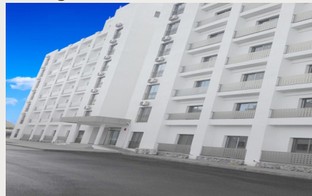
LAÜ Öğrenci Yurdu 4

Y aşanan büyük ölçekli öğrenci talebi doğrultusunda üniversiteye yeni yurtların kazandırılması amacıyla Türkiye'nin sağladığı finansman katkısı ile 4 no'lu yurt 6.250.000 TL'ye ihale edilmiştir. 29 Nisan 2014 tarihinde başlanan yurt, 7 aylık sürede ve 2014 takvim yılı içerisinde tamamlanmıştır.