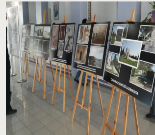
Kıbrıs'ta Çanakkale Esirleri Sergisi (18 Mart 2016 Şehitleri Anma Günü, Y.D.Ü.)

Halen Gazi Mağusa'da bulunan Çanakkale Şehitliği'nde isim ve mezarları bilinen 33, sadece isimleri bilinen; ancak maalesef mezarları bulunamayan 217 Çanakkale esiri bulunmaktadır. Bunun dışında KKTC'de bu esirler tarafından yapılmış ve kendilerine yardımcı olan Kıbrıslı Türklere armağan edilmiş tespih, sigaralık, enfiye kutusu, çeyiz kutusu/sandığı, kama, mermer oyma gibi çeşitli hatıra eşyalar çeşitli koleksiyonlarda bulunmaktadır.